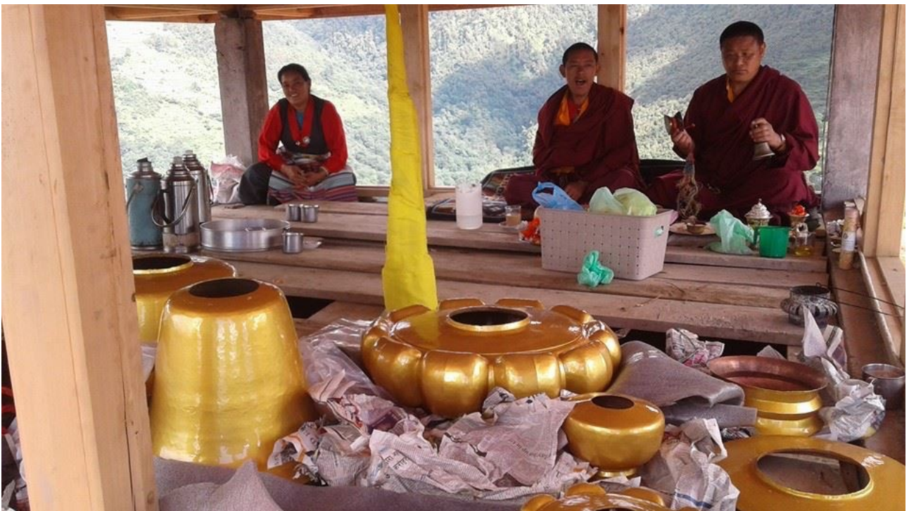
Deze gouden ornamenten staan op het dak van de gompa. De foto toont de inwijding door twee lama's.